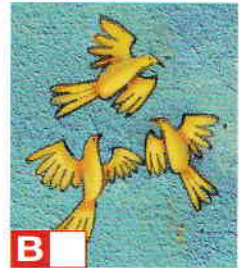
Les petits oiseaux

Quelle belle chanson ! Quelle belle danse !