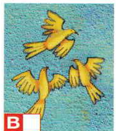
Les petits oiseaux